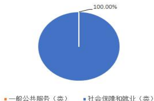
财政拨款支出决算结构情况